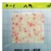
RIDA COUNT Sanita-kun